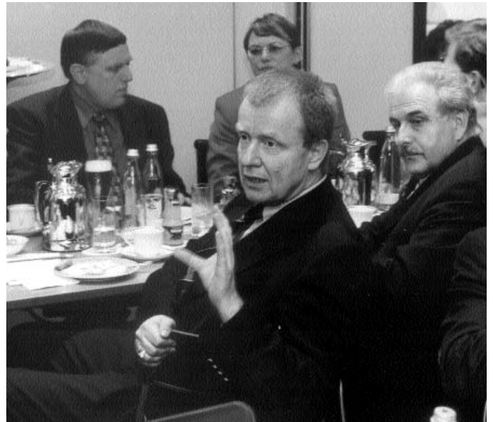
Einsatz für Münster in der Landesgruppe der nordrhein-westfälischen CDU-Abgeordneten

Die bisherige provisorische Sechsspurigkeit der Autobahn A 1 zwischen Münster-Süd und Münster-Nord ist unfallträchtig. Schon deshalb ist der Ausbau dringend. Hinzu kommt, dass der Bund nur bei einem Ausbau den dringend notwendigen Lärmschutz für Gievenbeck, Roxel und Kinderhaus finan-