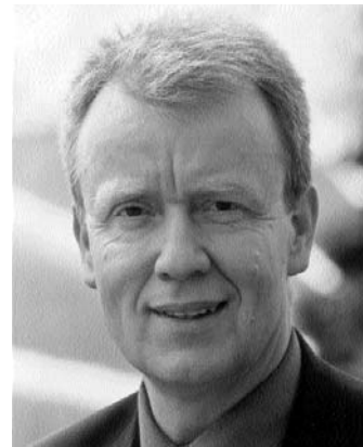
Ruprecht Polenz MdB Abgeordneter der Stadt Münster