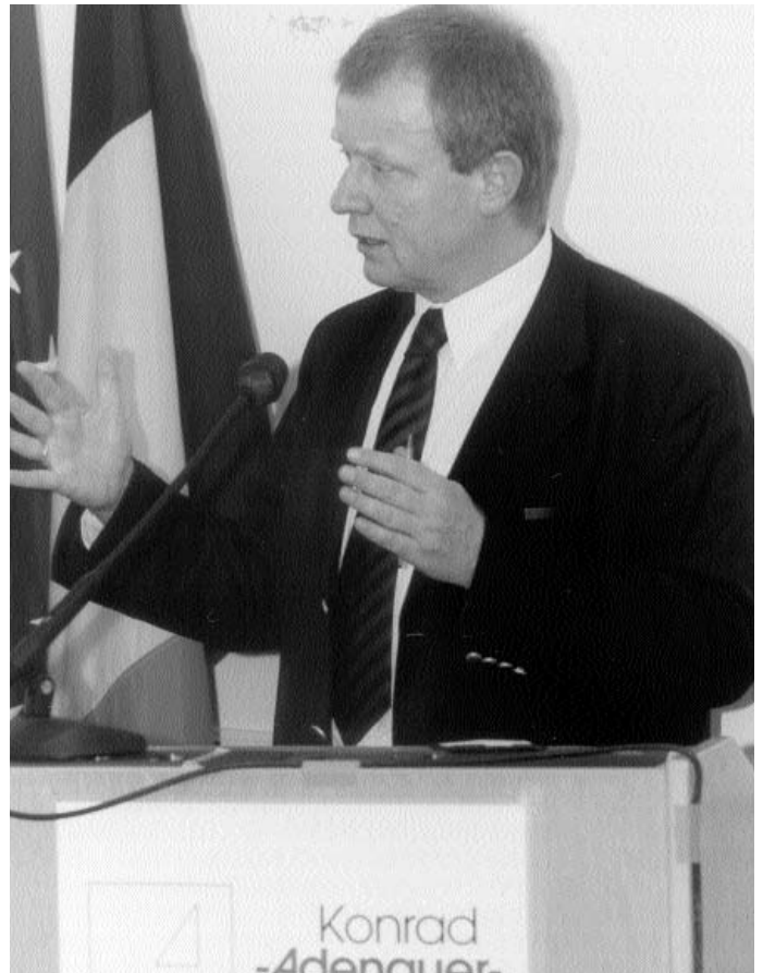
Engagierte Europäer. Hier bei einer Rede in Brüssel.

Auch beim Einsatz für Münster als Standort der Zollverwaltung habe ich mich eng mit den jeweiligen