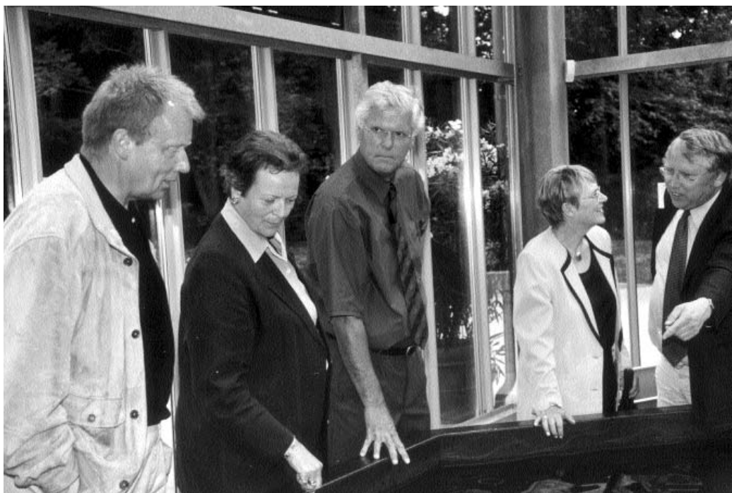
Enge und gute Kontakte zu den Entscheidungsträgern im Münsterland. Hier beim Besuch der Landesgartenschau in Oelde.