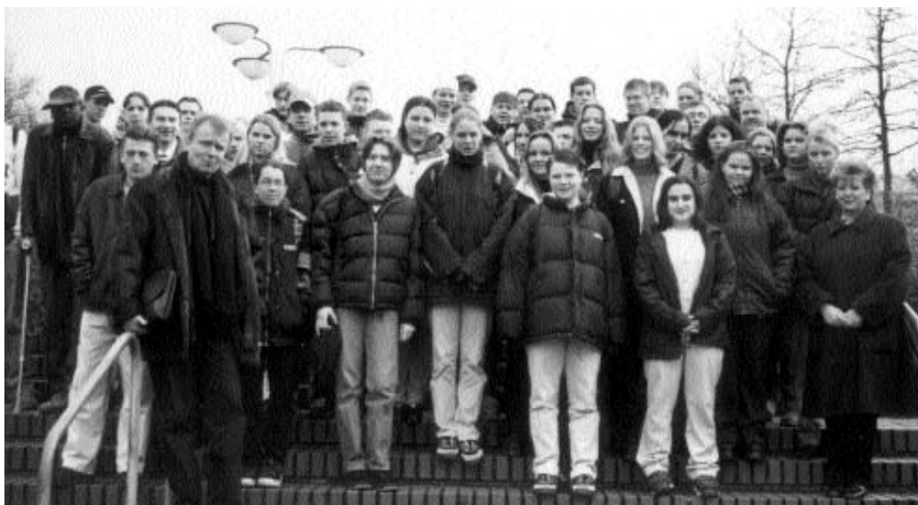
Zu Besuch bei Ruprecht Polenz in Berlin: Hier eine Klasse der Hauptschule Hilstrup.